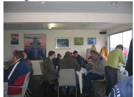
Er was geen stoel in het clubhuis meer vrij

Juist omdat het zo koud was liet een ieder zich de warme snert en bonensoep goed smaken, en het was dan ook behoorlijk druk in en rondom ons altijd gezellige clubhuis, waar iedereen zichtbaar zat te genieten van al dat lekkers.