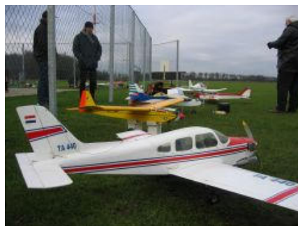
veel vliegtuigen ondanks het koude weer

De pits stond vol met model vliegtuigen en modelhelikopters en op het terras stonden twee vuurkorven met een sfeervol knapperend vuurtje. Al gauw werden de eerste modellen gestart en kregen de aspirant-leden hun eerste proefles.